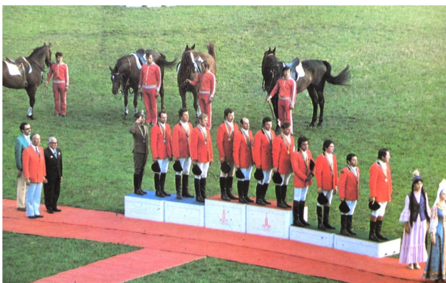
Fot. 3. Podium drużynowego konkursu skoków przez przeszkody (Moskwa, 1980 r.)