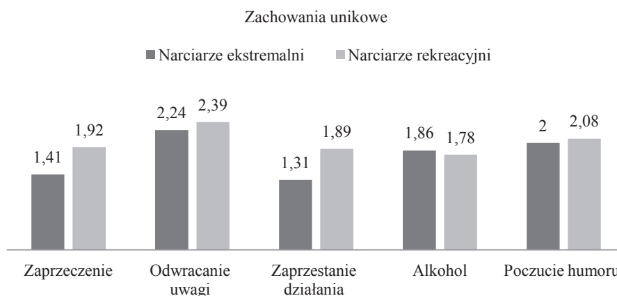
Ryc. 3. Wyniki stylów radzenia sobie ze stresem w grupie zachowań unikowych, z podziałem na narciarzy ekstremalnych i rekreacyjnych

Najbardziej znaczące różnice występują w stylu odnoszącym się do zaprzeczenia oraz do zaprzestania działania. Dwa kolejne style właściwe dla tej strategii, mianowicie odwracanie uwagi i poczucie humoru, nieznacznie częściej preferowane są w grupie narciarzy rekreacyjnych. I podobnie zauważalna jest przewaga narciarzy ekstremalnych, jeśli chodzi o sięganie po alkohol w sytuacjach stresowych.