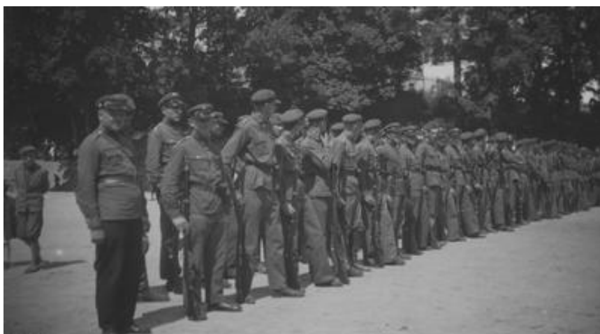
Fot. 1. Uroczystość Związku Strzeleckiego w Krzemieńcu – 6 sierpnia 1933 r.

w Czarukowie. Na terenie powiatu łuckiego wychowanie fizyczne kobiet było prowadzone w trzech oddziałach ZS: Kiwerce, Ławrów i Łuck-Miasto 32 .