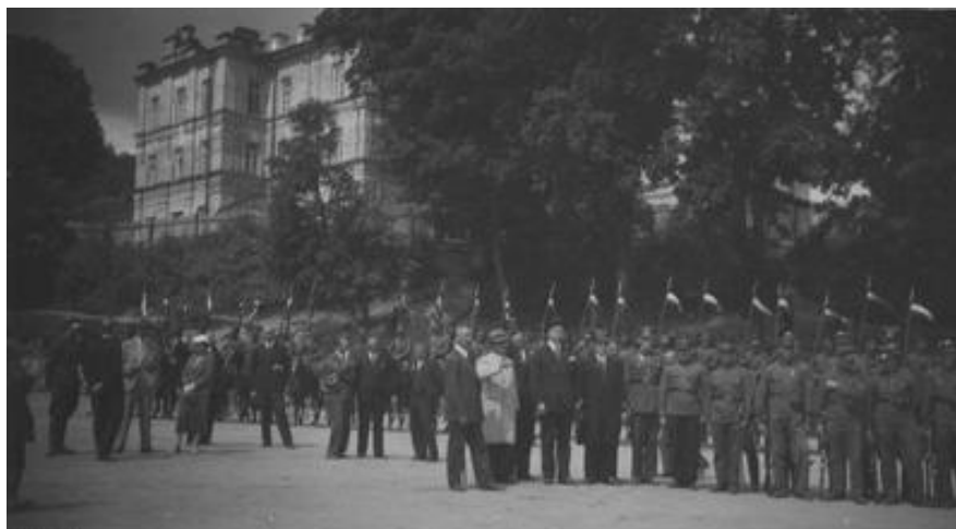
Fot. 2. Uroczystość Związku Strzeleckiego w Krzemieńcu – 6 sierpnia 1933 r.