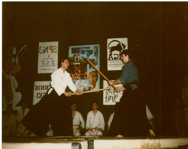
Fot. 8. Jeden z pokazów japońskich sztuk walki, na cel charytatywny, Rzeszów 1994