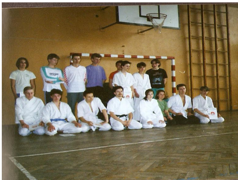
Fot. 6. Grupa strzyżowska RODB, 1992