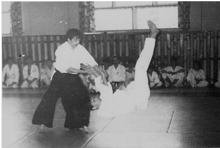
Fot. 7. Pokaz technik oryginalnego aiki-jujutsu , Rzeszów 1991 (ze zbioru autora)