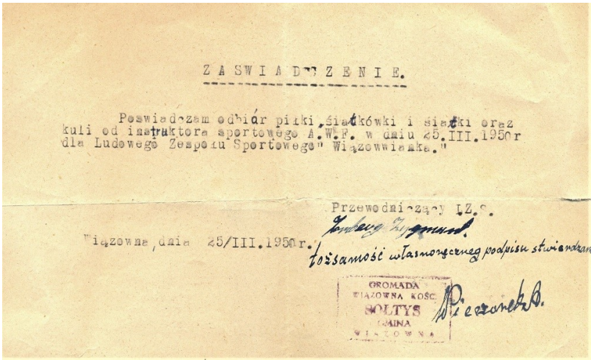
Fot. 4. Pokwitowanie odbioru sprzętu sportowego dla LZS „Wiązowianka”, 25 III 1950 r.