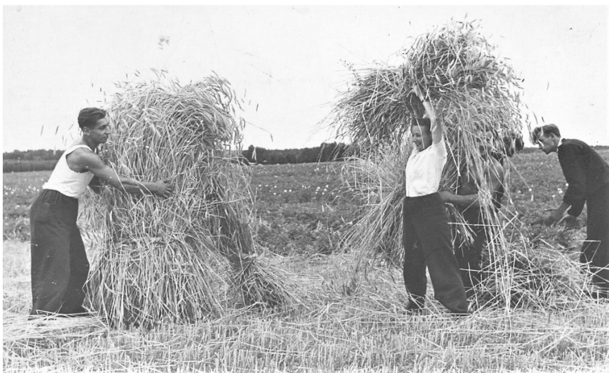
Fot. 6. Studenci AWF Warszawa podczas prac polowych w pierwszej połowie lat 50. XX w.

Podsumowując, należy stwierdzić, iż pomimo narzucenia środowisku akademickiemu udziału w akcji łączności miasta z wsią, w świetle źródeł archiwalnych, działania były podejmowane zwykle z autentycznym zaangażowaniem i zrozumieniem potrzeby usportowienia grup młodzieży, pozbawionych na co dzień dostępu do nowoczesnej kultury fizycznej. Dzięki pracy społecznej studentów Akademii Wychowania Fizycznego w Warszawie powstało w omawianym okresie wiele zespołów LZS, a te już istniejące otrzymały odpowiednie wsparcie organizacyjne. W czasie wolnym od nauki (niedziele) młodzież akademicka wyjeżdżała na wieś, wioząc ze sobą sprzęt sportowy, prowadząc zajęcia, treningi, ale także tzw. pogadanki, czy odczytując przygotowane referaty. Tym samym warszawski ośrodek wniósł znaczący wkład w proces usportowienia środowiska wiejskiego oraz jego rozwój cywilizacyjny.