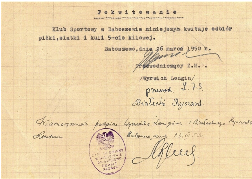
Fot. 5. Pokwitowanie odbioru sprzętu sportowego dla LZS Baboszewo, 26 III 1950 r.