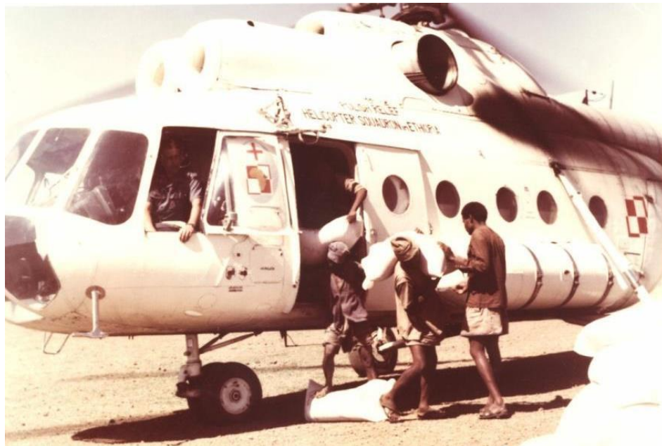
Fot. 1. Operacja „Tesfa” (Nadzieja). Przewożenie żywności podczas misji humanitarnej

w pierwszym, w dniach 16–26 lutego 1987 r., zaplanowanych do wylotu zostało 12 osób, w drugim – w połowie marca – 14 pozostałych osób 30 .