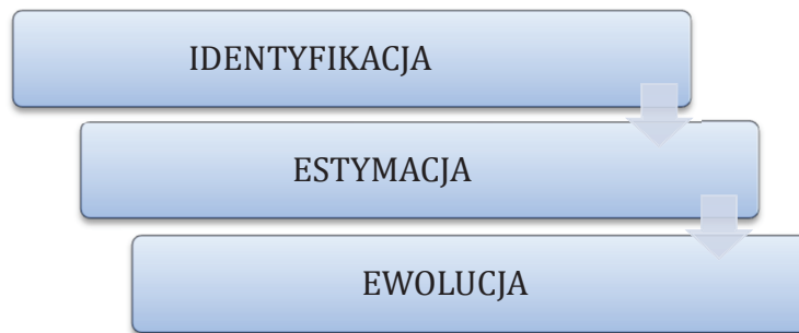
Ryc. 2. Przebieg procesu analizy ryzyka

czyli określenie, czy istnieje możliwość akceptacji ryzyka i jaka ona jest, jakie są inne możliwości wyboru oraz jakie straty są poniesione z jego tytułu.