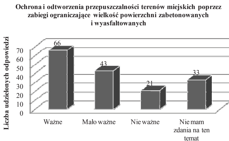
Ryc. 3. Ocena działań służących ochronie wód polegających na chronieniu i odtwarzaniu przepuszczalności terenów miejskich

powierzchni zabetonowanych i wyasfaltowanych za działania nie ważne i mało ważne z punktu widzenia ochrony wód (ryc. 3).