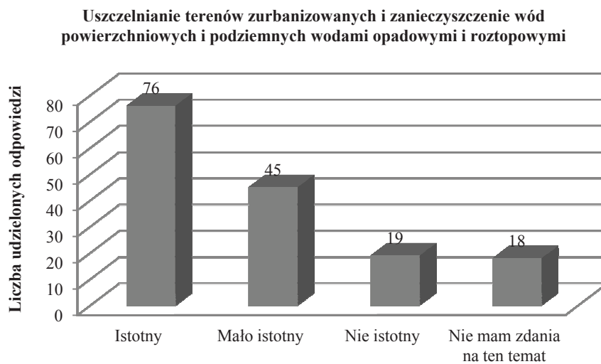
Ryc. 1. Opinie mieszkańców województwa śląskiego na temat istotności uszczelniania terenów zurbanizowanych i zanieczyszczenia wód powierzchniowych i podziemnych wodami opadowymi i roztopowymi jako jednego z problemów gospodarki wodnej na terenie zamieszkania

W badaniach ankietowych przeprowadzonych wśród mieszkańców województwa śląskiego przez pracowników Katedry Zarządzania Ochroną Środowiska Uniwersytetu Ekonomicznego w Katowicach, realizowanych w pierwszym kwartale 2013 roku, prawie połowa respondentów (48%) uznała uszczelnianie terenów zurbanizowanych i zanieczyszczenie wód powierzchniowych i podziemnych wodami opadowymi i roztopowymi za istotny problem gospodarki wodnej na terenie ich zamieszkania (ryc. 1).