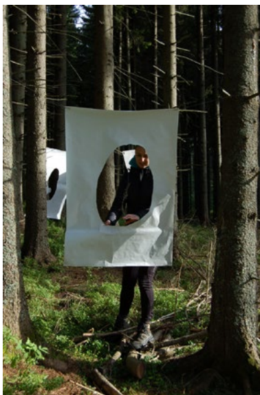
7. Plenér 2016, premodelovanie, b.d., foto: autorka