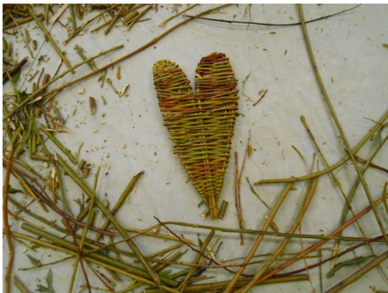
1. Plenér 2014, košíkářstvo, eco-art, b.d., foto: autorka