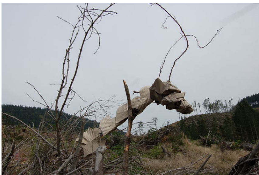
9. Plenér 2016, fantazijne bytosti, paketáž, b.d., foto: autorka