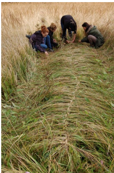
8. Plenér 2016, premodelovanie, b.d.