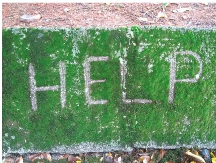
12. Plenér 2017, apropiácia, b.d.