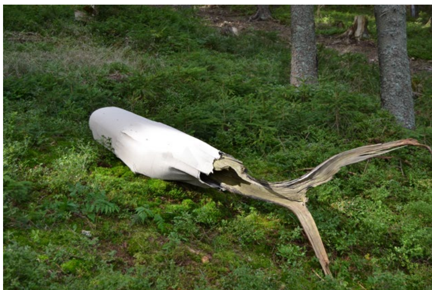
6. Plenér 2016, paketáž – papier, b.d., foto: autorka