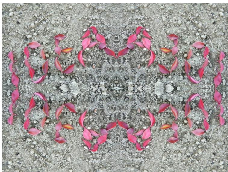
10. Plenér 2017, apropiácia, b.d.