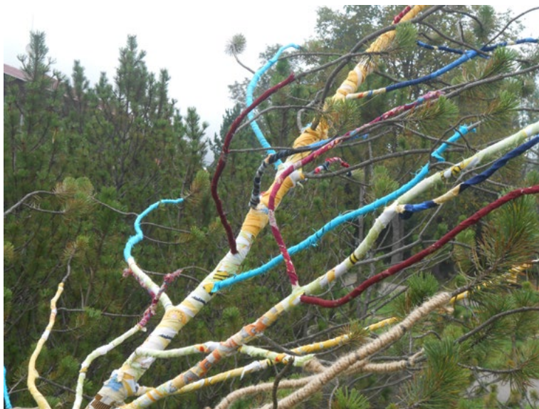
5. Plenér 2015, obal'ovanie/paketáž – textil, b.d., foto: autorka