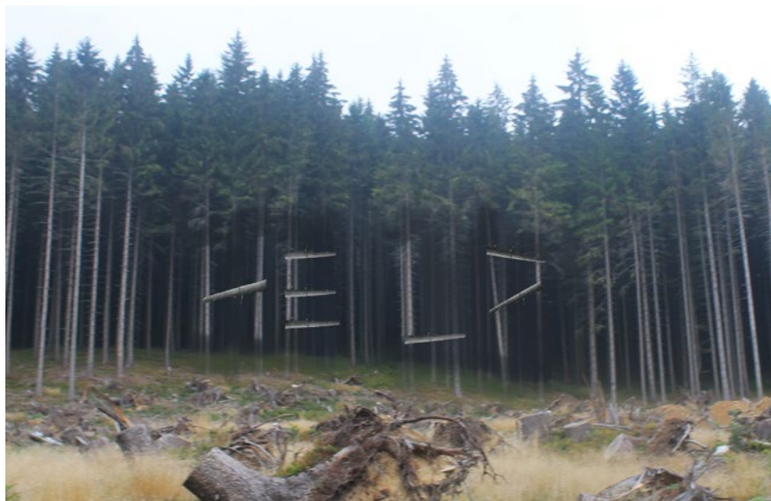
11. Plenér 2017, apropiácia, b.d.