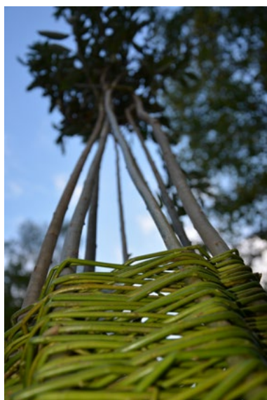
2. Plenér 2014, košíkářstvo, eco-art, b.d.