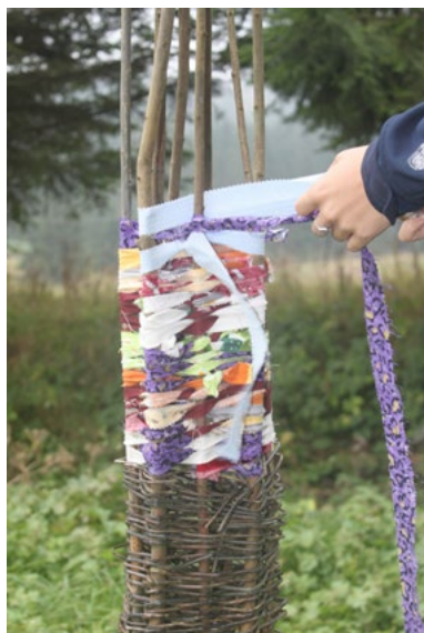
4. Plenér 2015, revitalizácia/doplnenie, b.d.