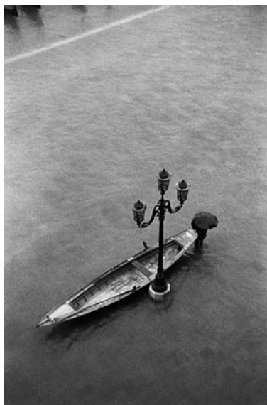
2. Waław Nowak, z cyklu Opowieść włoska , Wenecja 1957