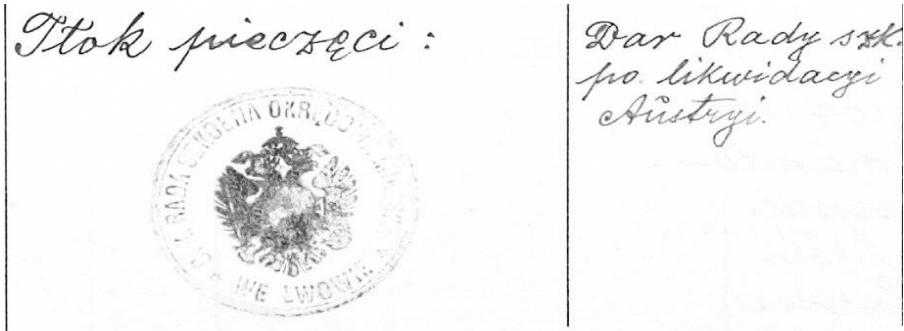
Фот. 1. Відтиск печатки Шкільної Ради (№ 87).