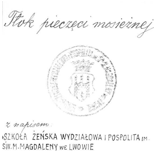
Фот. 3. Відтиск печатки школи ім. св. М. Магдалени (№ 125).

Історію львівського шкільництва наглядно ілюструє гумова печатка жіночої народної школи ім. Г. Сенкевича (№ 115). Круглої форми, має у центрі герб Львова з короною, оточений написом: «Miejska szkoła pospolita żeńska im. Sienkiewicza we Lwowie». 11 Подібною є шкільна печатка за інв. № 116. 12 Цікавим музейним предметом стала шкільна печатка, круглої форми з написом: «Szkoła żeńska wydziałowa i pospolita im. św. M. Magdaleny we Lwowie» (№ 125) 13 (фот. 3).