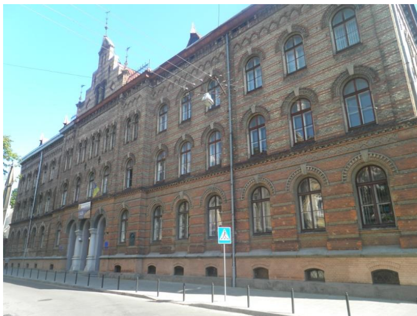
Fot. 2. Budynek pedagogium – dziś siedziba Instytutu Pedagogiki Uniwersytetu im. Iwana Franki we Lwowie (lipiec 2017)