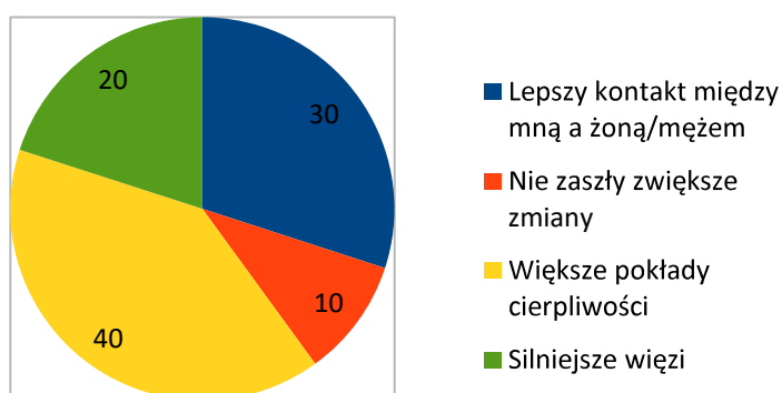
Wykres 2. Zmiany w rodzinie po pojawieniu się dziecka z niepełnosprawnością?

Blisko 70% rodziców deklaruje, iż największe trudności sprawia im „nieobecność” dziecka, utrudniony kontakt: „Gdy mówię do dziecka i mówię, a ono nie słyszy, jest nieobecne, bo jest czymś zajęte”. 7% rodziców w dalszym ciągu zadaje sobie pytanie dlaczego?