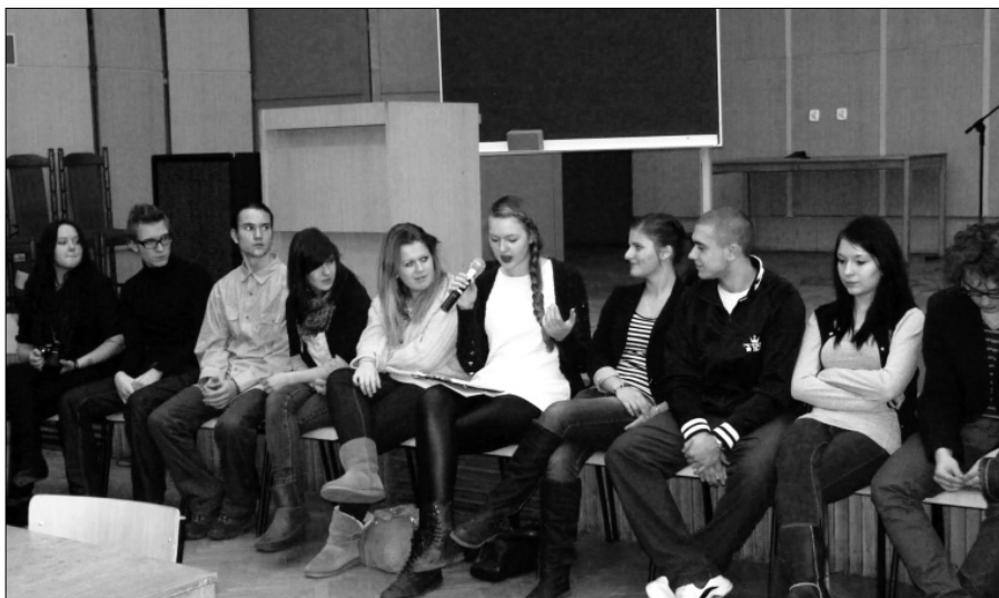
Fot. 1. Dyskusja młodzieży podczas panelu „Młodzież a wartości”

We wszystkich diskutowanych tezach ujawniały się krytyczne oceny współczesnej edukacji, a zarazem troska o jej przyszłość. Rozmówcy pytali, czy polska oświata nadąża za obecnym tempem życia, transformującymi się paradygmatami zachowań i oczekiwań, które często są wymuszane coraz szybciej zachodzącymi zmianami pokoleniowymi, kulturowymi i cywilizacyjnymi. W dyskusji pojawiły się bardzo wyraźne postulaty przywrócenia należytego miejsca filozofii w ramach programu szkół ponadgimnazjalnych, co wynikało z aksjologicznej oceny edukacji. Młodzież domagała się podjęcia w ramach kształcenia ważkich treści dotyczących szeroko rozumianej religii oraz refleksji aksjologicznej. Dostrzeżona została potrzeba nowego spojrzenia na nauczanie owych przedmiotów z perspektywy społecznej i obywatelskiej. Młodzież podkreślała także wartość płynącą z podejmowania inicjatyw edukacyjnych ukierunkowanych na takie dyscypliny, jak: psychologia, socjologia, pedagogika oraz filozofia z jej warstwą aksjologiczną, estetyczną, etyczną i poznawczą.