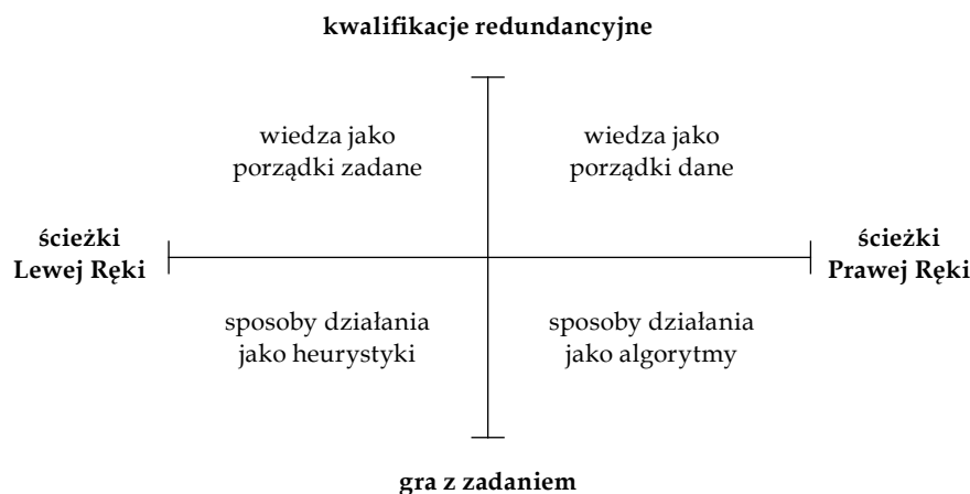
Schemat 1. Model holistycznego rozwoju zawodowego nauczyciela