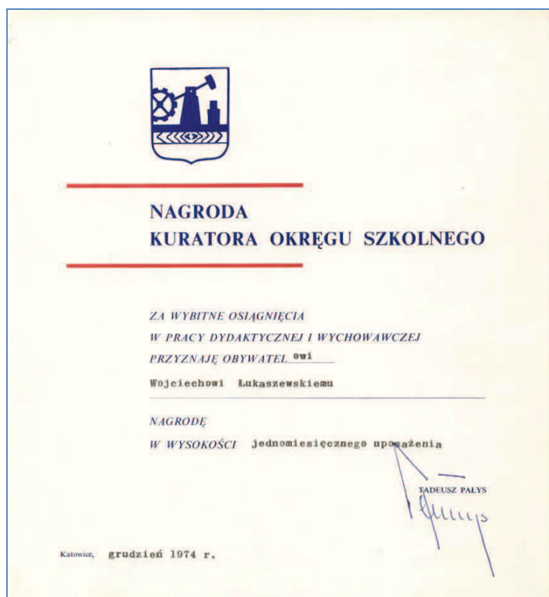
Fot. 2. Dyplom potwierdzający uzyskanie Nagrody Kuratora Okręgu Szkolnego za wybitne osiągnięcia w pracy dydaktycznej i wychowawczej

Jako nauczyciel, a od roku 1971 dyrektor Państwowej Szkoły Muzycznej I i II stopnia w Częstochowie osiąga bardzo dobre wyniki nauczania i wychowania. Na przestrzeni kilku ostatnich lat rozwinął znacznie w szkole niektóre specjalności, a szczególnie instrumenty dęte. Wzrost zainteresowania tymi instrumentami pozwolił na zorganizowanie w szkole orkiestry dętej, która na ogólnopolskim konkursie młodzieżowych orkiestr dętych w Inowrocławiu osiągnęła jedno z czołowych miejsc. Jako kompozytor i teoretyk dba o szeroką popularyzację współczesnych osiągnięć w muzyce, zarówno wśród uczniów, jak i w akcji koncertowej na rzecz społeczeństwa. Wykazuje niezwykłą dbałość o warunki pracy nauczycieli i młodzieży mimo borykania się z ogromnymi trudnościami lokalowymi. Angażuje młodzież i rodziców do wielu akcji na rzecz szkoły, jak i szerokiej działalności koncertowej, zarówno w mieście, jak i na terenie powiatu [...]. W pracy zawodowej jak i społecznej wykazuje wiele inicjatywy, niezwykły takt i kulturę osobistą, co pozwala mu na pozytywne rozwiązywanie wielu problemów szkoły [...] 10 .