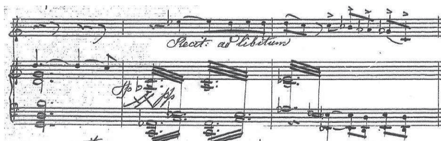
Przykład 5. Grzegorz Fitelberg, I Sonata a-moll , część II, Andante cantabile , takty 62–64

W II części, Andante cantabile , Fitelberg jeszcze dobitniej ukazuje swą umiejętność ewolucyjnego rozwijania regularnego, symetrycznego tematu. Bardzo śpiewny i ekspresyjny temat poddany został przekształceniom fakturalnym i technice wariacyjnej (pierwsze ogniwo A). Ogniwo środkowe B w żywszym tempie podaje nową frazę, która splata się w repryzie z tematem głównym, tworząc ją dłuższą i bardziej rozbudowaną od ekspozycji. Po tematycznej kulminacji młody kompozytor zastosował innowacyjny chwyt, mianowicie skrzypcowy recytatyw ad libitum na tle fortepianowego tremolanda (akompaniamentu tematu ogniwa B). Praktyka recytatywnych inwokacji w muzyce romantycznej z reguły była stosowana na początku utworu lub części – tutaj pełni funkcję wyrazowej kody.