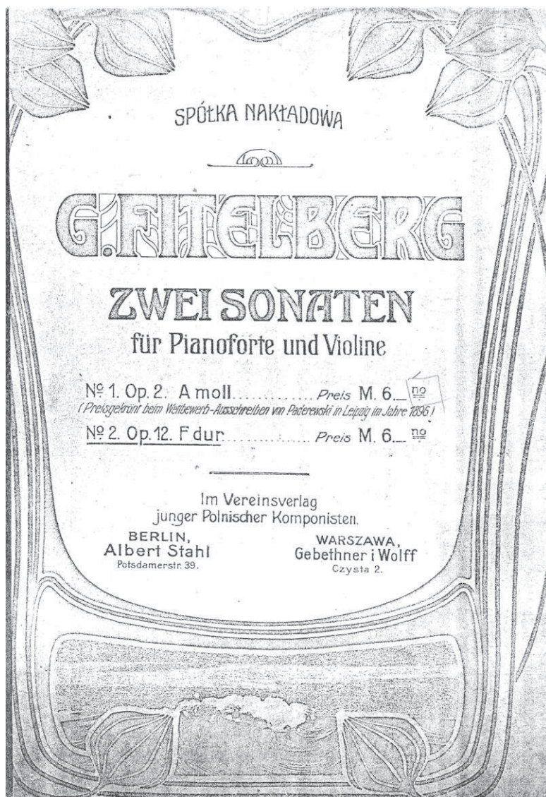
Ilustracja 2. Strona tytułowa wydania Spółki II Sonaty F-dur z 1905 roku