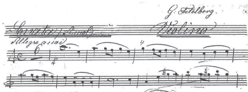
Przykład 2. Grzegorz Fitelberg, I Sonata a-moll na skrzypce i fortepian op. 2, część I, Allegro assai . Temat pierwszy (partia skrzypcowa), takty 1–15 23

Trzyczęściowa I Sonata a-moll oparta została na wzorcach klasycznych. Urzeka swą inwencją melodyczną, prostą, utrzymaną w I części Allegro assai w nostalgicznym tonie. Główny temat poruszający się tonalnie między a-moll eolskim i harmonicznym jest lapidarny w swej okresowej konstrukcji. W rozwoju wątku tematycznego młody kompozytor posługuje się pracą motywiczną. Wyodrębnia dwa motywy tematu, sekwencyjnie przenosząc je do coraz wyższego rejestru. Buduje kulminację pośrodku płaszczyzny tematycznej, a po niej kontynuuje jej narrację z użyciem techniki korespondencji motywicznej między fortepianem i skrzypcami. Klasyczna modulacja do C-dur poprzedza pogodny, pastoralny w charakterze drugi temat. Jego rozwój jest zbliżony do przebiegu tematu pierwszego. Epilog kształtem melodycznym jednoczy struktury przejęte z obydwu tematów.