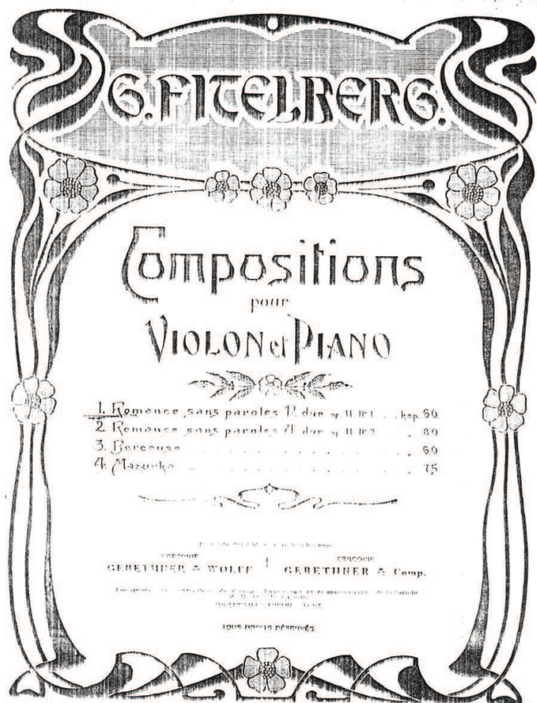
Ilustracja 1. Strona tytułowa wydania miniatur skrzypcowych Grzegorza Fitelberga oficyny Gebethner & Wolf (1914–1918)

Pierwszy utwór, Romance sans paroles D-dur op. 11 nr 1, już w samym tytule ujawnia swe pokrewieństwo z idiomem mendelssohnowskiej liryki instrumentalnej, a także z rosyjską liryką wokalną. Alfred Einstein w monografii o muzyce romantycznej wskazuje na sentymentalizm jako naczelną cechę Lieder ohne Worte Mendelssohna. W rozwinięciu swej tezy objaśnia: