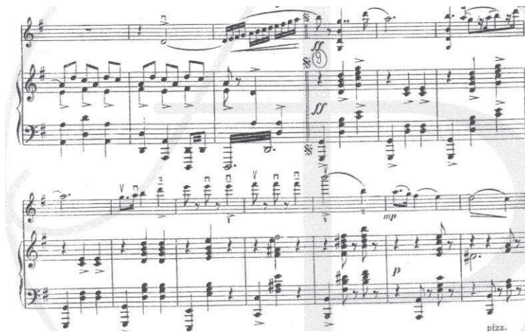
Przykład 7. Grzegorz Fitelberg, Mazurka , takty 6–18

Miniatura ta, w tonacji G-dur, odznacza się prostotą, zarówno tonalno-harmoniczną, jak i fakturalną. Wszystkie środki zostały podporządkowane uwypukleniu cech mazurowych. Melodyka o linii falistej postępuje w szerokim ambitusie, eksponuje rytm punktowany na pierwszej części taktu.