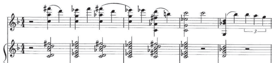
Przykład 14. Grzegorz Fitelberg, Koncert skrzypcowy d-moll , cz. I, Allegro appassionato , fragment akordów skrzypcowych. z towarzyszeniem harfy

akordowy akompaniament harfy, harmonicznie dublujący akordy skrzypiec 44 . Następstwa akordowe w kadencji wskazują na silne rozluźnienie związków funkcyjnych i swobodne operowanie akordami dysonansowymi.