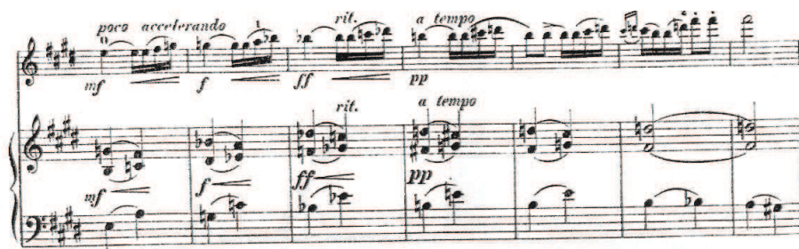
Przykład 6. Grzegorz Fitelberg, Berceuse , kulminacja w A 1 , takty 35–41

Berceuse , podobnie jak obydwie Romance sans paroles , należy do typu miniatury jednolitej wyrazowo, jej muzyczna treść wyprowadzona jest z pierwszej frazy. Spójność materiałową zakłada już sam temat, w którym następnik jest melodycznym wariantem poprzednika, z zastosowaniem odwrotnego kierunku następstw interwałowych. Modalna, łagodna linia tematu wynika ze stabilnego podłoża harmonicznego, opartego na wymianie dwóch podstawowych akordów: subdominanty i toniki, a w rytmice na miarowym, kołyszącym ruchu ćwierćnotowym. Partia fortepianu utrzymana jest na przestrzeni całego utworu w tym samym rodzaju faktury. Wynika to oczywiście z przyjętej koncepcji utworu – kołysanki. Ewolucja materii tematycznej kształtuje się poprzez pracę motywiczną, swobodną technikę progresji, zasadę selekcji fraz, powtarzanych w ruchu wznoszącym, ze stopniowaniem dynamiki. Trzyczłonowa budowa Berceuse (A A 1 A) intensyfikuje przebieg w ogniwie środkowym. Rozwój tematu prowadzi już w ekspozycyjnym ogniwie A do pierwszej kulminacji, a w A 1 do kulminacji na wyższym harmonicznym stopniu rozwoju – w odległej tonacji b-moll i w spotęgowanej dynamice. Fraza tematu powtarzana jest wręcz ostinato w toku ewolucyjnych działań i nie ulega przekształceniom tonalno-melicznym.