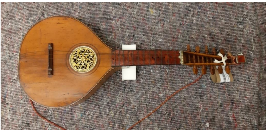
Ryc. 1. Gitara angielska ze zbiorów Victoria & Albert Museum w Londynie.

Był to instrument stosunkowo niewielkich rozmiarów, o średniej menzurze 42 cm, zbliżony wyglądem do cittern , przypominający mandolinę. Istniał w wielu odmianach – najpopularniejsza posiadała 10 metalowych strun, w sześciu chórach, o tzw. stroju otwartym C 1 , rzadziej występował też A i G (taki strój był zazwyczaj stosowany na terenach Polski). Skala obejmowała najczęściej 2,5 oktawy. Na szyjkę nabitych było od 12 do 19 mosiężnych progów, a płaskie lub wypukłe pudło rezonansowe mogło przyjmować kształty nawiązujące do gruszki, tzy, figi, jajka, chmury lub dzwonu. W szyjce często wiercono otwory służące do mocowania kapodastra, co pozwalało wykonawcom w łatwy sposób zmienić tonacje utworów, choćby podczas akompaniowania do śpiewu. Droższe instrumenty posiadały liczne elementy dekoracyjne w postaci fornirów i inkrustacji, ozdabiano je kosztownymi materiałami, jak heban, masa perłowa czy kość słoniowa. Miały też bardziej precyzyjne mechanizmy do strojenia, szereg dodatkowych akcesoriów oraz etykiety lub grawerowane znaki firmowe liczących się warsztatów i lutników.