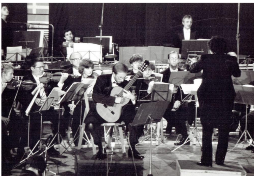
Ilustracja 4. Prawykonanie Concerto per chitarra e orchestra podczas koncertu inauguracyjnego IV Śląską Jesień Gitarową.

Na kolejną kompozycję z gitarą autorstwa Bogusławskiego przyszło czekać środowisku gitarzystów aż 20 lat; na przełomie 1991 i 1992 roku powstało bowiem Concerto per chitarra e orchestra 18 . Utwór ten wpisuje się w obecną przez całe życie twórcze Bogusławskiego serię kompozycji o koncertującej formie. Pierwszym utworem tego gatunku było Concerto per oboe anche, oboe d'amore, corno inglese, musette e orchestra (1967–1968). W kolejnych latach powstały jeszcze Concerto per oboe anche, musette, soprano e orchestra (1975–1976), Musica concertante per saxofono alto e orchestra (1979–1980), Concerto per pianoforte e orchestra (1980–1981), Symfonia koncertująca na skrzypce i orkiestrę kameralną (1982), Concerto per acordeono solo, batteria e archi (1985), Play na flet i orkiestrę kameralną (1988), a także skomponowane już po koncercie gitarowym Concerto per organo e orchestra (1996) oraz Concerto-Fantasia per contrabasso e archi (1999) 19 .