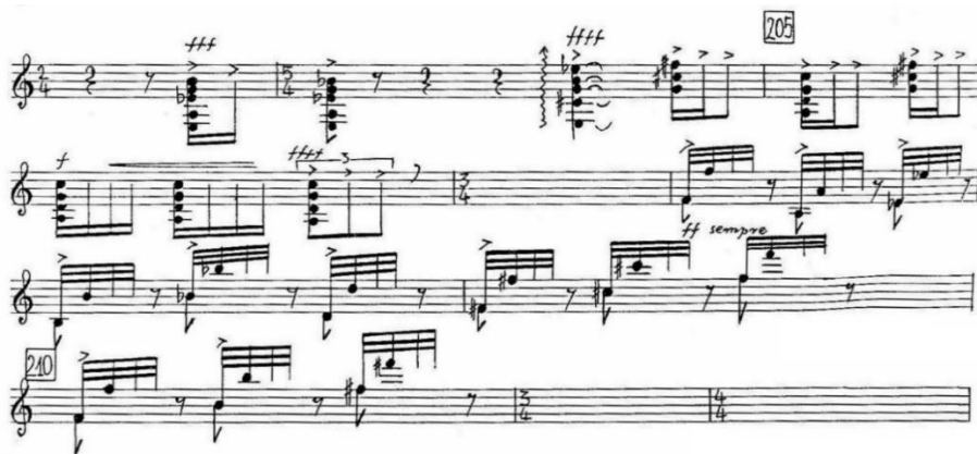
Ilustracja 5. Concerto , część III, takty 203–212, słupy akordowe i przebiegi quasi-tremolowe ; drugi takt przykładu zawiera niewykonalny na gitarze akord, wymagający zagrania dwóch dźwięków na trzeciej, czwartej bądź piątej strunie, zależnie od wybranej aplikatury. Źródło: E. Bogusławski, Concerto per chitarra e orchestra , Zarząd Miasta Tychy, Tychy 1992, partia gitary, s. 8.