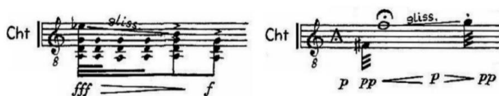
Ilustracja 3. Trio , część VII, przykłady niemożliwych technicznie do wykonania fragmentów. Źródło: E. Bogusławski, Trio per flauto, oboe e chitarra , PWM, Kraków 1974, s. 9–10, 12.

Analizując partię gitary ze strony wykonawczej, trzeba jednak stwierdzić, że instrument ten był nowy nie tylko dla odbiorców, ale też i dla twórcy – niektóre pomysły kompozytorskie w partii gitary wykraczają bowiem poza możliwości wykonawcze dostępne dla tego instrumentu 16 . Wśród nich wymienić można m.in. crescendo zanotowane na pojedynczym, długim dźwięku z fermatą lub różne wersje glissando , np. opadające między IV progiem a pustą struną realizowane na tle repetowanych akordów w dynamice od fff do f czy glissando pomiędzy dźwiękami oddalonymi o interwał sekundy wielkiej, z precyzyjnie zanotowaną dynamiką do wykonania w trakcie jego trwania. Tego typu zabiegi nie były już obecne u Bogusławskiego w kolejnych utworach gitarowych.