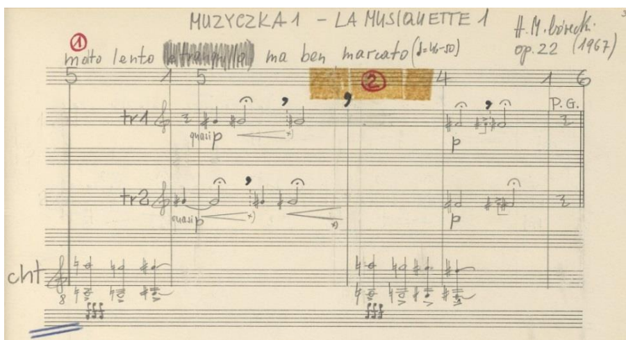
Ilustracja 1. Pierwszy system Muzyczki I op. 22 Henryka Mikołaja Góreckiego. Źródło: https://polona.pl/item/muzyczka-1-la-musiquette-1-re-na-dwie-trabki-i-gitare-op-22-1967,MTI4MTYzMTc5/6 [stan z 25.03.2021].